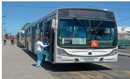
% Buses con filtro de partículas