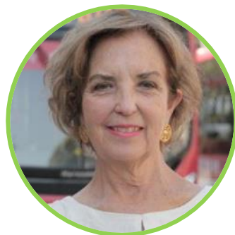
Gloria Hutt Hesse

Minister of Transport and Telecommunications, CHILE